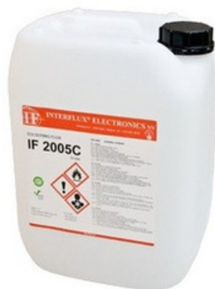
La photo n'est pas contractuelle

Le flux est classé dans les normes IPC et EN comme OR/L0.